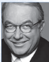
Uwe Beckmeyer MdB , Arbeitsgruppe Verkehr, Bau und Stadtentwicklung der SPD-Fraktion im Deutschen Bundestag