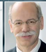
D. Zetsche Daimler