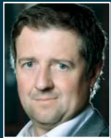
C. Schnell Handelsblatt