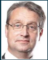
G. Steingart Handelsblatt