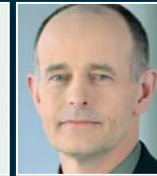
T. Douglas BMW