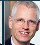
H. Schmieding Berenberg Bank