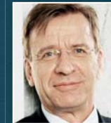
H. Samuelsson Volvo