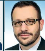
S. Landua Volkswagen