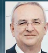
M. Winterkorn Volkswagen