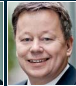
P. Fuß Ernst & Young