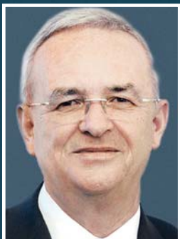
Prof. Dr. Dr. h.c. mult. Martin Winterkorn Vorsitzender des Vorstandes Volkswagen AG

Strategien. Innovationen. Kooperationen. Visionen.