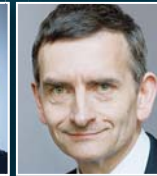
V. Perthes SWP