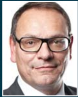
H.-J. Jakobs Handelsblatt