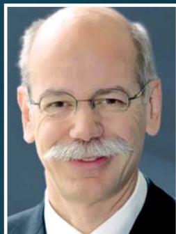
Dr.-Ing. Dieter Zetsche Vorsitzender des Vorstandes Daimler AG