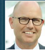
F. Meijer Hyundai