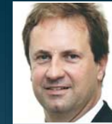
K. Crede Allianz