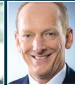
K.-T. Neumann Opel