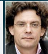
F. Sieren Handelsblatt