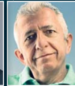
F. M. Rinderknecht Rinspeed