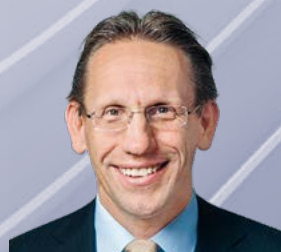
Dr. Jörg Kukies Staatssekretär, Bundesministerium der Finanzen